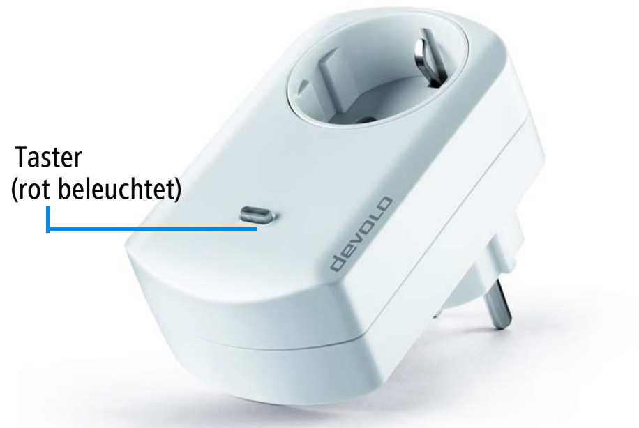
Abbildung ist länderspezifisch

Die Home Control Schalt- und Messsteckdose kann in jede Steckdose des Hauses eingesteckt werden. Sie wertet das angeschlossene Gerät mit nützlichen Funktionen auf wie z. B. das zeitgesteuerte An- und Ausschalten und der Stromverbrauchsmessung.