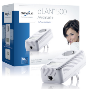
dLAN® 500 AVsmart+

Zeigt Status und Verbindungsqualität zu den anderen Adaptern im Heimnetzwerk.