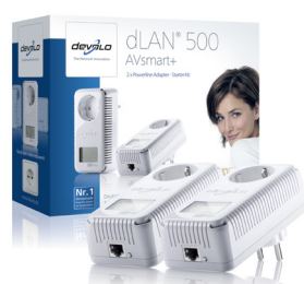
dLAN® 500 AVsmart+ Starter Kit